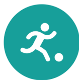
Spel en beweging / bewegingsonderwijs